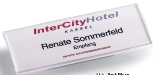
Abb: ProfiPlexx 75x35 mm